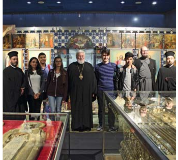
Nuorisodelegaatio Konstantinopolista vieraili kirkkomuseossa Kuopiossa 19. heinäkuuta.