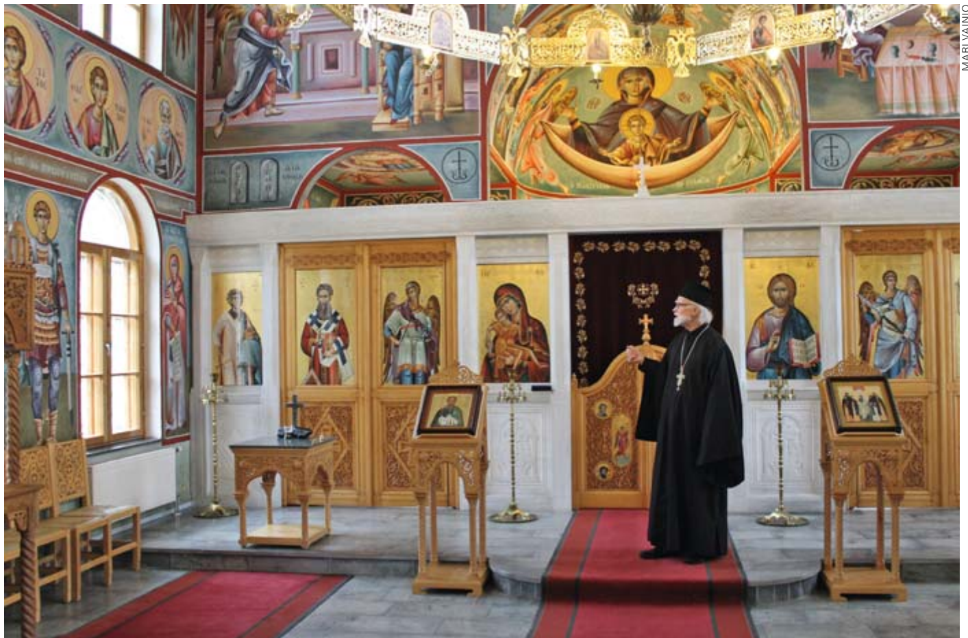
Rakkain työn lahja Leo Iltolalle on seminaarin Kaikkein pyhimpien Jumalansynnyttäjän kirkko.

Kotkan yhteisö oli jakaantunut suomenkielisiin ja venäjänkielisiin jäseniin.