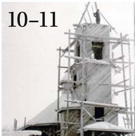
SUOMEN ORTODOKSIINEN KIRKKOMUSEO RIISA

Sodan loputtua ortodoksinen kirkko ja sen karjalaiset jäsenet joutuivat rakentamaan elämänsä uudelleen. Kuvassa rakennetaan Imatran kirkkoa.