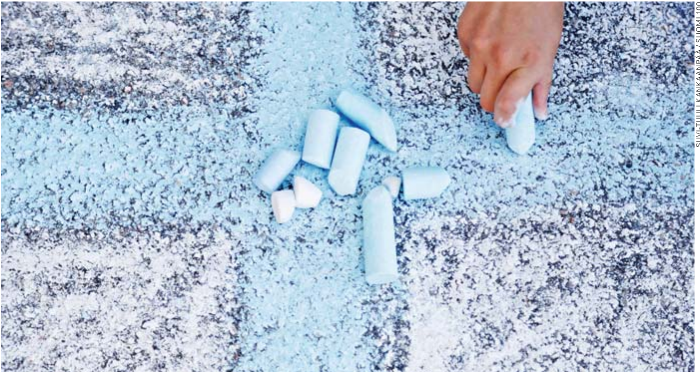
SUVI-TUULI KANKANPÄÄ / SUOMI 100