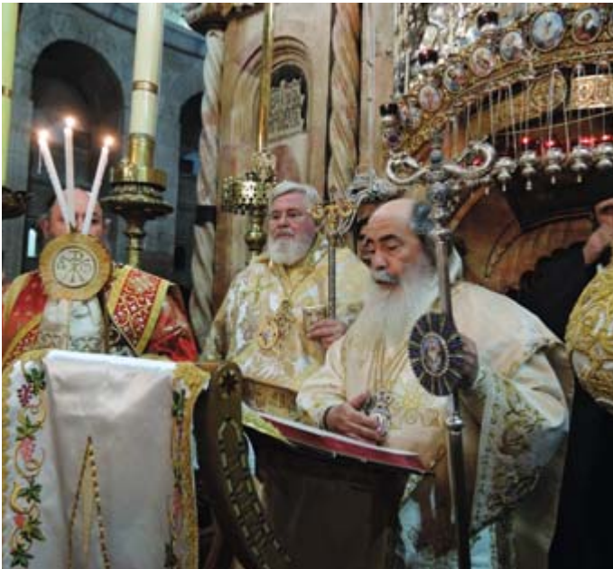
Patriarkka Teofilos lukee pääsiäispäivänä 16. huhtikuuta ehtoopalveluksen evankeliumia Pyhän haudan kirkossa Jerusalemissa.