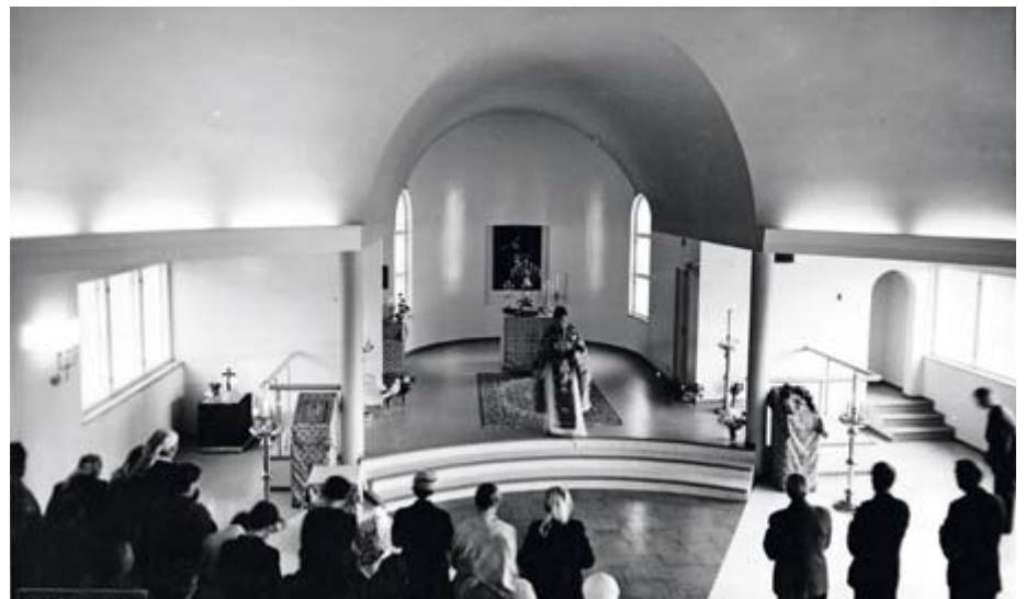
Varkauden ortodoksinen kirkko ennen ikonostaasin valmistumista. Kirkko vihittiin käyttöön 25.9.1960.

Rajakarjalaiset saivat asettua Pohjois-Karjalaan, Pohjois-Savoon ja Oulun läänin eteläosiin, paikoin hyvinkin karuille ja harvaanasutuille seuduille. Sijoitusalue oli melko yhtenäinen ja tällöin täytettiin myös uskontunnustuksellinen yhtenäisyyden vaati-