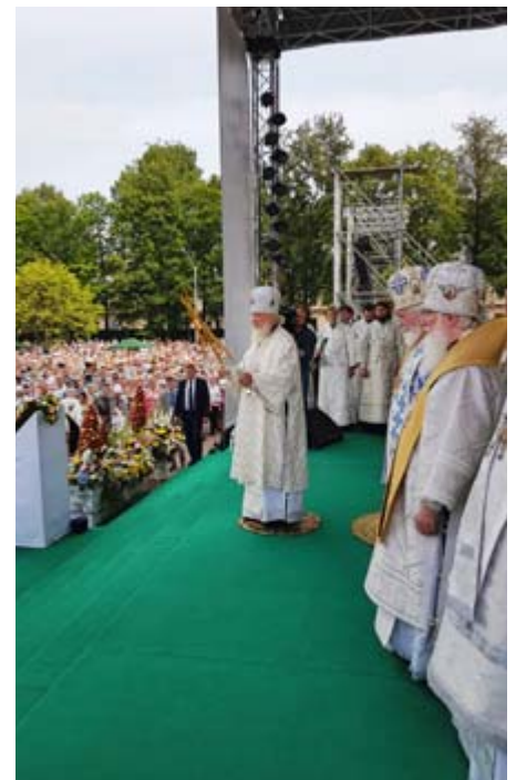
Patriarkka Kirill johti Viipurin hiippakunnan 125-vuotisjuhlaliturgiaa 19. elokuuta.