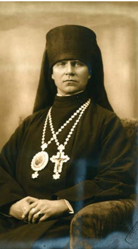
SUOMEN ORTODOKSINEN KIRKKOMUSEO RIISA

Arkkipiispa Herman vihittiin piispaksi Konstantinopolissa 8.7.1923 ja sai virkanimekseen Karjalan piispa. Arkkipiispan kaulassa ovat hänen suunnittelemansa sinivalkoisella emalilla koristellut panagia ja risti.