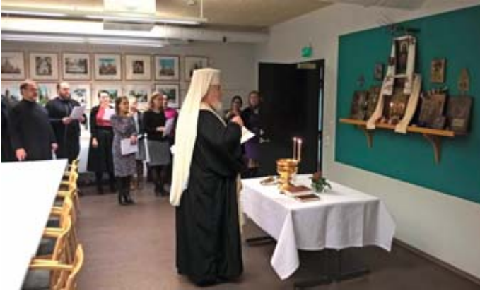
Viipuri-säätiöltä saatujen ikonien siunaustilaisuus