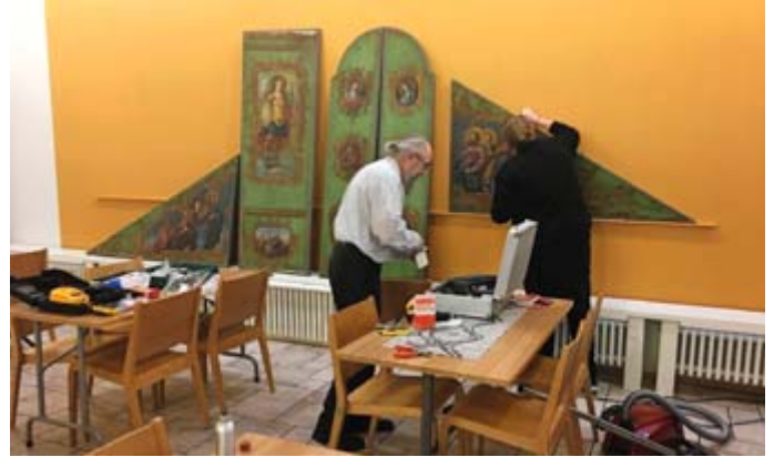
1700- luvulta peräisin oleva matkaikonostaasi ripustettiin keskuksen yläsaliin.