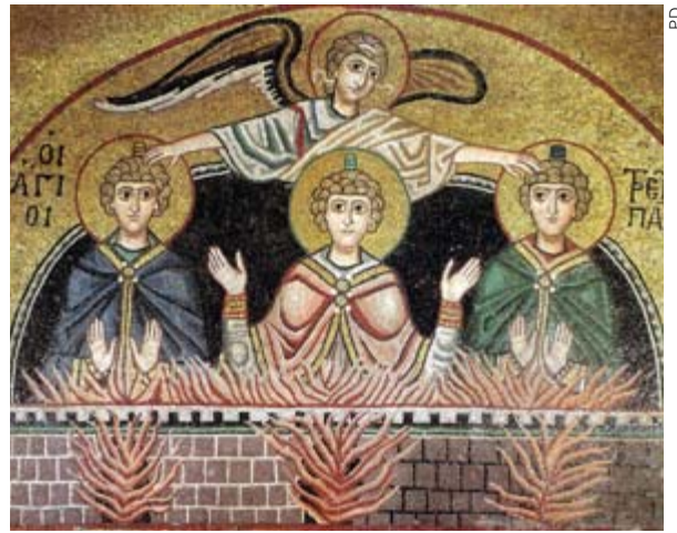
Kolme hurskasta nuorukaista – Hananja, Miisael ja Asarja – pelkäsivät ainoastaan Jumalaa, eivät mitään eivätkä ketään muuta. Herran enkeli pelasti nämä uskon sankarit Babylonin tulisesta pätsistä. [Dan. 3]

”Rakkaus on saavuttanut meissä täytty-myksensä, kun me tuomion päivänä astumme rohkeasti esiin. Sellainen kuin Jeesus on, sellaisia olemme mekin tässä maailmassa. Pelkoa ei rakkaudessa ole, vaan täydellinen rakkaus karkottaa pelon. Pelossahan on jo rangaistus-