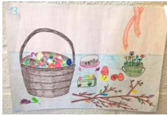
Varkauden seurakuntasalin seinät peittyivät näyttävistä pääsiäispiirustuksista koululaisten kirkkopäivänä.

Mieshenkilö vastaa numerossa 044 294 1836 ja naishenkilö vastaa numerossa 045 119 0293.