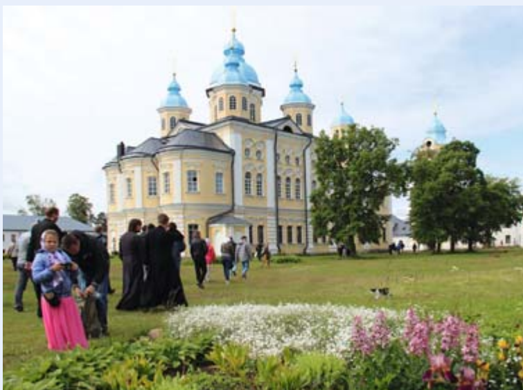
Konevitsan luostarin jälleenrakentamisesta on kulunut 25 vuotta. Viime syksynä luostarisaaressa alkoi tapahtua suuria muutoksia, joihin elokuun matkalla voi tutustua.

Tiedustelut ja ilmoittautumiset pe 16.6. mennessä Jarmo Ihalaiselle puh. 040 747 5200 tai nettisivuilta: ortsaimaa.net .