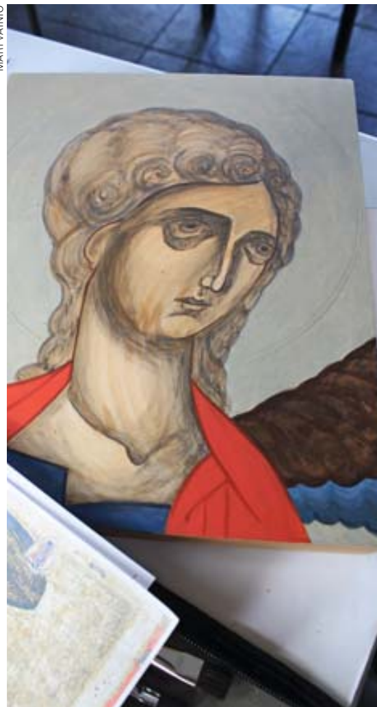
Ikonimaalaus vahvistaa kristillistä opintietä.

Kun ikonimaalauksen suosio oli 1970-luvun puoliväliin tultaessa levinnyt jo varsin laajalle, ilmeni lieveilmiöitä, kuten ikonimaalauksen muuttuminen joillekin ajanvietteharrastukseksi ja liian varhaista oppilastasoisten teosten myyntiä ikoneina. Ikonien oikeaoppisuutta ja laatua pyrittiin kontrolloimaan piispaikokouksen määräyksellä perustetun ikonineuvoston avulla. Siihen nimettiin tiedoiltaan ja taidoiltaan tunnettuja ikonimaalareita ja sen oli tarkoitus työskennellä muutama kerta vuodessa. Ikonineuvosto kokoontui kuitenkin vain pari kertaa vuodessa kahden vuoden aikana. Ajatus kontrollista oli hyvä, mutta osoittautui käytännössä mahdottomaksi toteuttaa.