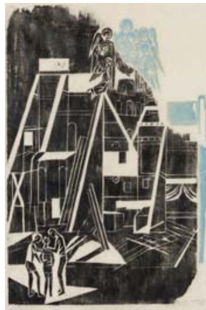
Jälleenrakentaminen, väripuupiirros 1964.