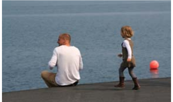
Björgvin Björgvinssonin valokuva Islanti-valokuvanäyttelystä.