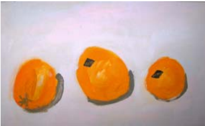
Isä Ioann Sotnikovin öljyväriyö ”Kolme marokkolaista”.