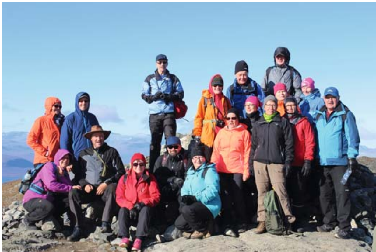
Ruskaretkeläisiä Saanan huipulla.