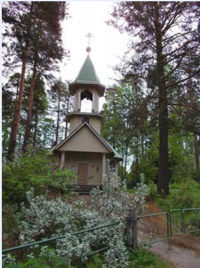
Ajastaan rapistunut Pieksämäen Neitsyt Marian syntymän kirkko saatetaan nykyaikaiseksi keväällä suoritettavassa remontissa.