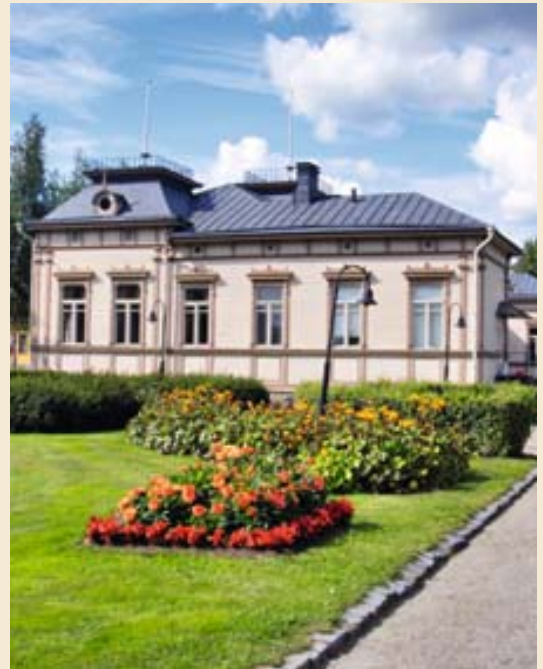
Seurakuntamme toimisto sijaistee vanhan raatihuoneen tiloissa.

Iisalmissa seurakuntakoulun kevätlukukauden aiheena ovat mysteerit eli sakramentit. Kaksi kertaa kuussa pidettävät oppitunnit ovat keväällä seuraavasti: 9.2., 23.2., 9.3., 23.3., 6.4., 20.4. ja 4.5. Koulu on tarkoitettu ortodokseille ja ortodoksisesta kirkosta kiinnostuneille. Jokainen koulupäivä alkaa Iisalmen seurakuntasalissa klo 18. Tervetuloa seurakuntakoulun pulpettiin oppimaan ja keskustelemaan uskomme perusteista.