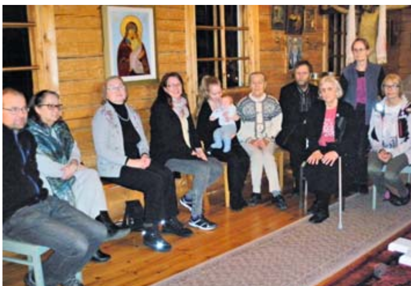
Alapitkän tiistaiseuralaiset yhteiskuvassa.