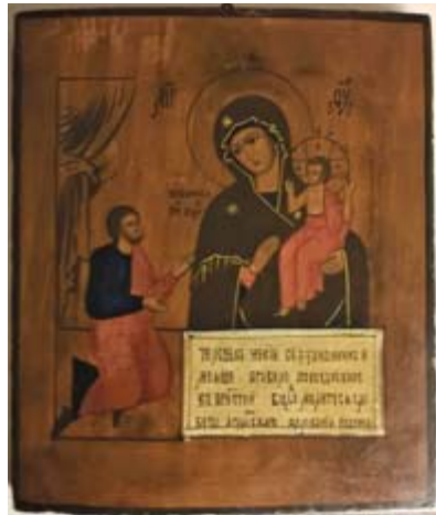
Jumalanäiti "Odottamaton ilo" (1900-l alku) 31 x 26,5 cm, tempera pohjustetulle puulle.

Luovutushetki on erinomainen keskuksen kannalta, koska meneillään olevassa EU- osarahoittamassa kehittämissankkeessa mm. kehitetään ja uudis-