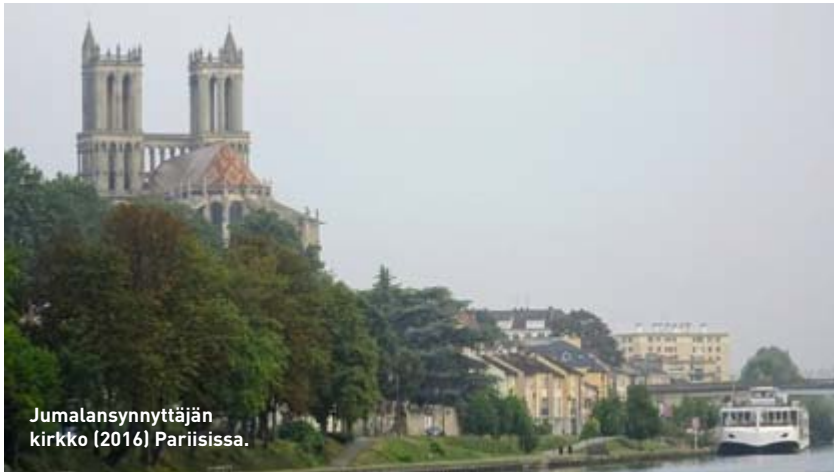
Jumalansynnyttäjän kirkko (2016) Pariisissa.