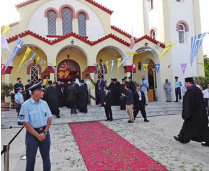
Synodi alkoi liturgialla sielujen lauantaina 18. kesäkuuta Jumalan-synnyttäjän ilmestysjuhlan katedraalissa Kissamoksessa.