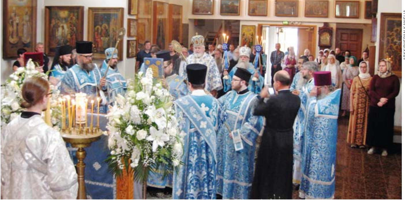
Arkkipiispa Leo ja Petroskoin metropoliitta Konstantin juhlatiurgiansa Valamossa 7. elokuuta.