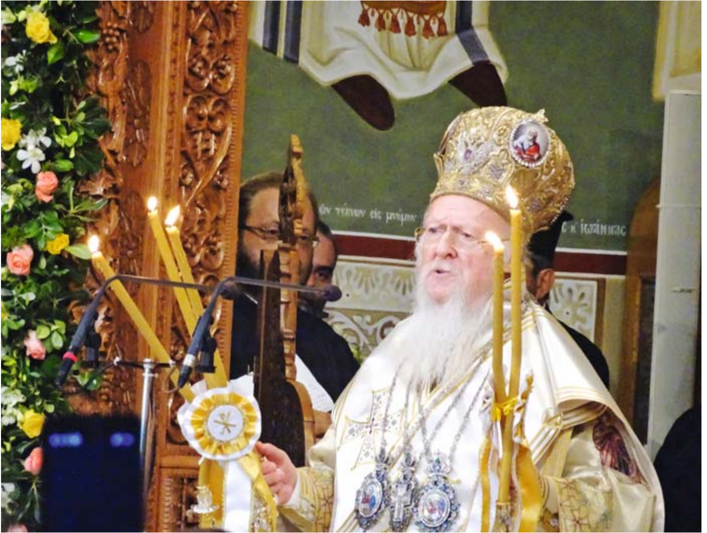
Patriarkka Bartolomeos helluntaijuhlan liturgiassa 19. kesäkuuta Pyhän Menaksen katedraalissa Irakliossa.