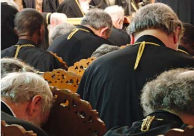
Suuri ja Pyhä Synodi alkoi Kreetalla helluntaijuhlena 19. kesäkuuta.