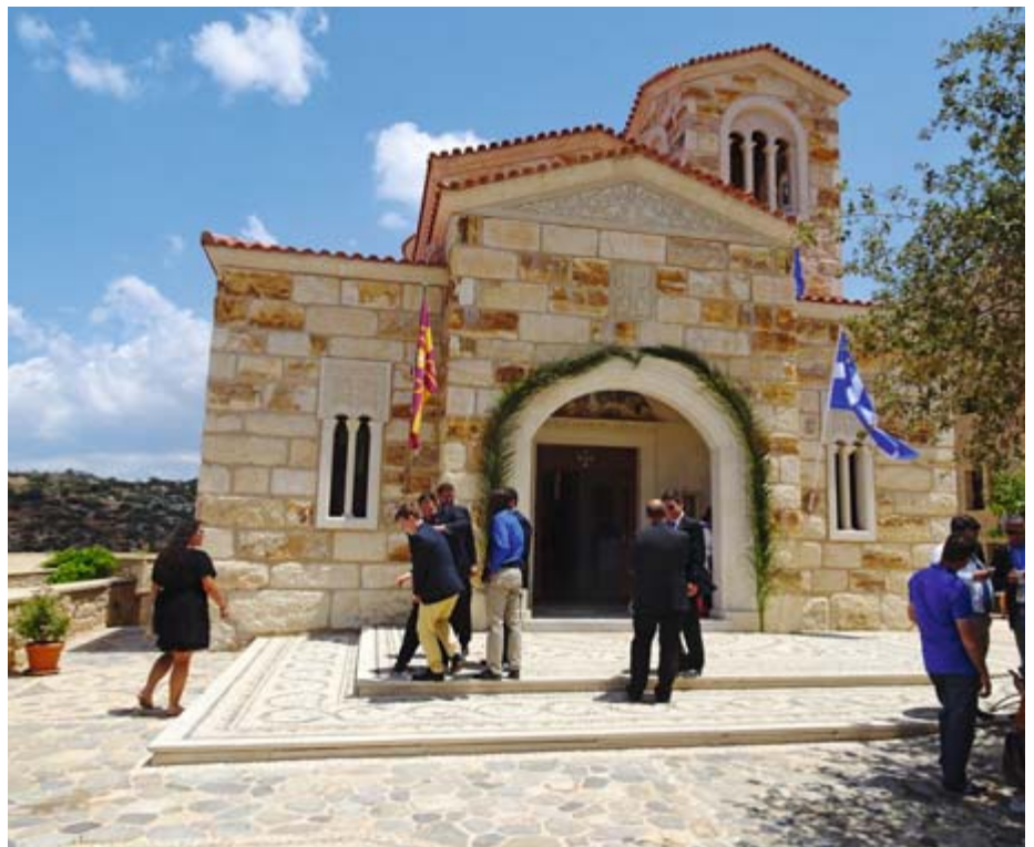
Synodi päättyi Kaikkien Pyhien sunnuntaina 26. kesäkuuta Kristuksen kirkastumisen luostarissa Hanian Kastrassa.