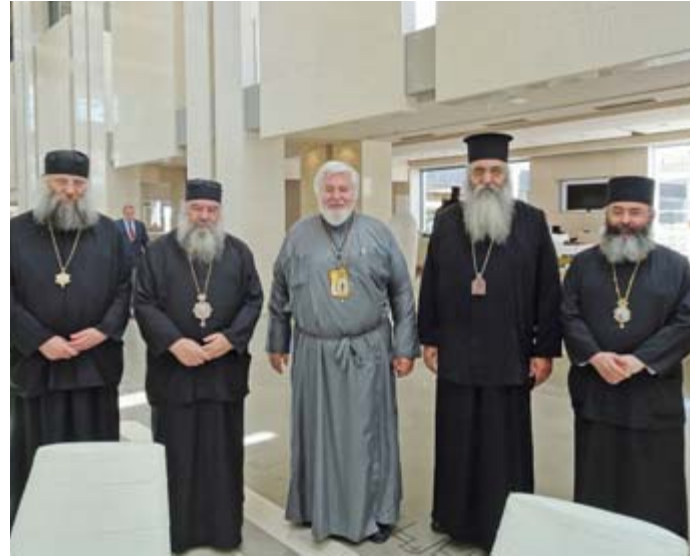
Arkkipiispa Leo yhdessä Kyproksen kirkon piispojen kanssa.

kon suhteisiin muuhun kristilliseen maailmaan liittyy sisäisiä jännitteitä. Länsi-Euroopassa ja Pohjois-Amerikassa katolinen kirkko tai protestanttiset kirkot ovat käytännössä ortodoksisen kirkon kumppaneita. Itä-Euroopassa ja Lähi-idässä kirkkojen suhteet muistuttavat enemmän kilpailutilannetta. Ortodoksisen kirkon piirissä on erityisesti Itä-Euroopassa ja Kreikassa paljon ekumenian vastaisuutta.