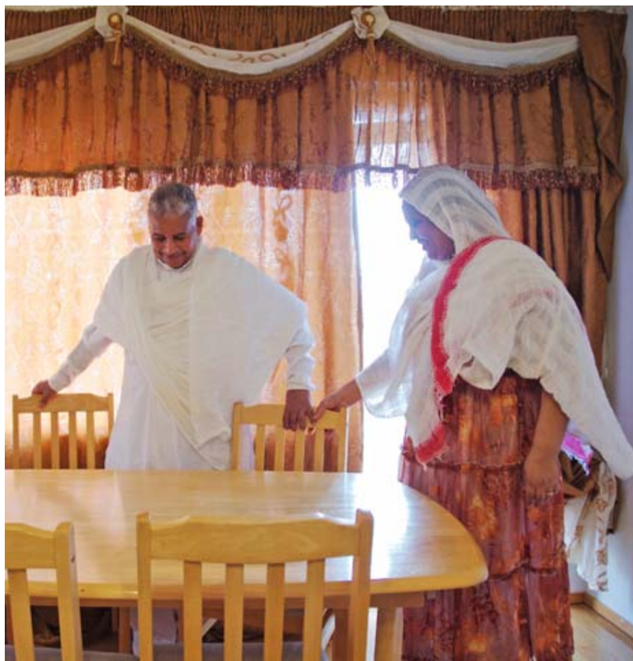
Suomeen asettumista auttoi ortodoksinen kirkko.