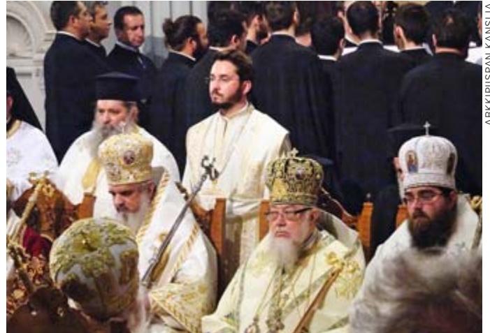
Romanian patriarkka Daniel, Puolan metropoliitta Sawa ja Tšekinmaan ja Slovakian metropoliitta Rastislav helluntain liturgiassa Kreetan pääkaupungin Iraklionin katedraalissa.

lähtien ja sen kokoontuminen oli ihme itsessään. Synodiin osallistui delegaattina 164 piispaa kymmenestä ortodoksisesta paikalliskirkosta. Heidän lisäksi Synodissa oli piispojen avustajina ja neuvonantajina yli sata munkkia, pappia ja maallikkoja.